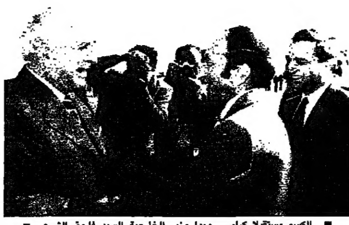
الرئيس الأسد لدى استقباله رئيس الحكومة السيد رشيد كرامي (سلف)

يعد قبل ظهر اليوم في العاصمة السورية اجتماع وزاري لبناني - سوري موسع يحضره الوزراء سليم الحص ونبية بري ووليد جنبلاط إضافة إلى الرئيس رشيد كرامي وذلك في مكتب نائب الرئيس السوري السيد عبد الحليم خدام. وكان السيد خدام اتصل مساء امس بالوزيرين السوريين وبعلمه لزيارة دمشق والمشاركة في مناقشة مجمل القضايا اللبنانية التي طرحها الرئيس رشيد كرامي خلال اجتماعه امس مع المسؤولين السوريين وانها ما يتناول اسباب عرقلة تنفيذ الخطة الأمنية السليمة والاقليم وبيروت والجبل والطرقات التي رافقت استقلاله وعودة الوزير الحص، أي الملف الأمني اللبناني برمته، والاسباب التي تعوق مسيرة الجيش اللبناني في الجنوب. في وجود رئيس الحكومة ونصف اعضاء الوزارة في دمشق لتجلى جلسة مجلس الوزراء اليوم في ظل الحص، وكان الرئيس حافظ الأسد استقبال رئيس الحكومة السيد رشيد كرامي بعد ظهر امس بحضور السيد عبد الحليم خدام نائب رئيس الجمهورية والدكتور